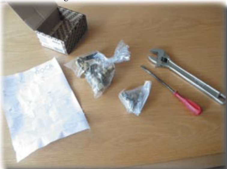
Inhoud verpakking: Epoca-kraan, voetventiel, ontluichter en 3 talige handleiding.