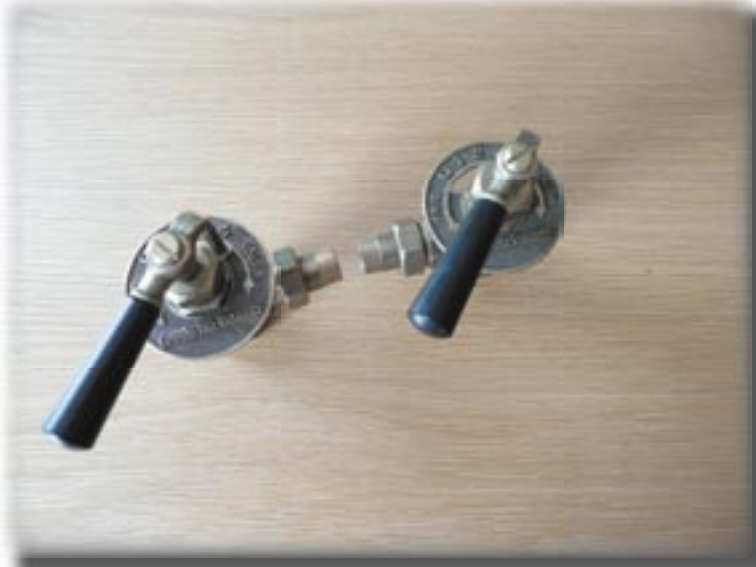
Links ziet u de linkse uitvoering, rechts de standaard rechtse uitvoering.