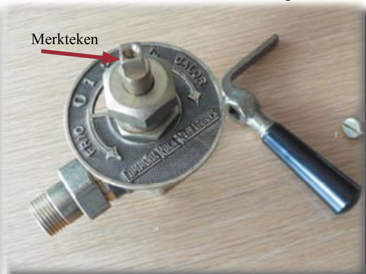
Verdraai de spindel nu niet meer en zorg dat het merk- teken in dezelfde positie blijft staan.