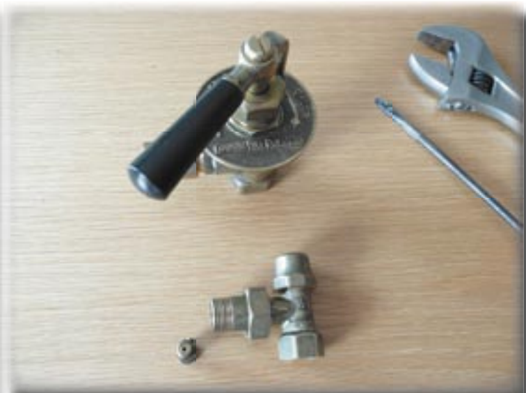
Standaard is de Epoca-kraan bedoeld voor de rechterzijde van de radiator. De linkse variant is eenvoudig te maken.