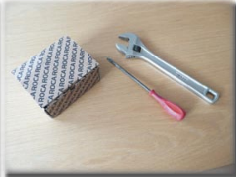
Verpakking en benodigd gereedschap.